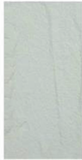
Color number: 2 Hanyu White